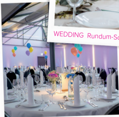
MASCHINENHALLE Events & more